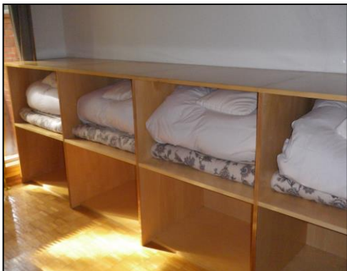
オリオン以外の部屋タイプの場合