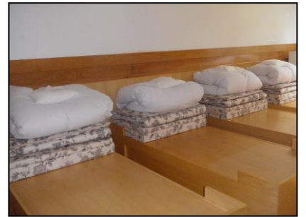
オリオンのお部屋