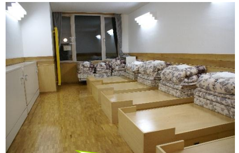
宿泊室オリオンの1階は、ベッドルーム2つと和室1つ