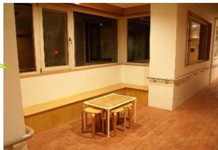
宿泊棟廊下にある休憩コーナー