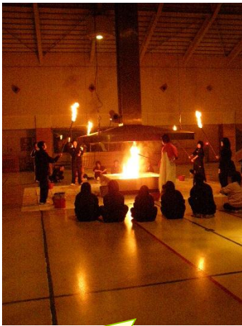
キャンプファイヤーやパークゴルフが可能な体育館