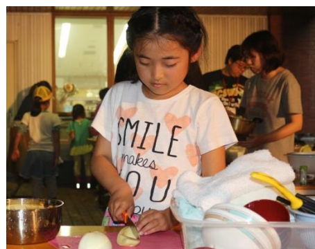
防災キャンプクッキング